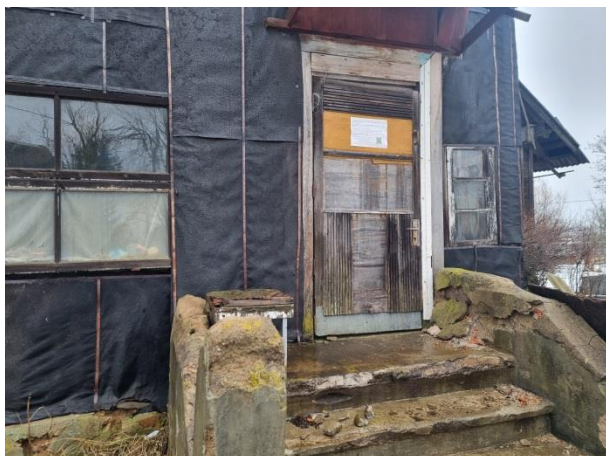
Dzīvokļa ieejas durvis