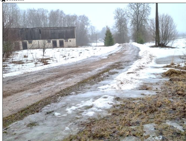
Skats uz piebraucamo ceļu