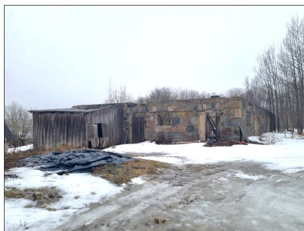
Skats uz palīgkām