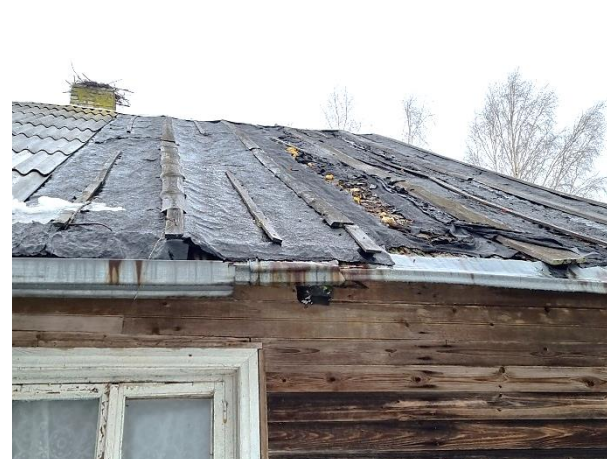
Dzīvojamās mājas ārskati