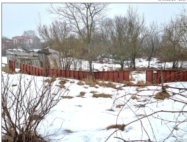
Skats uz teritoriju